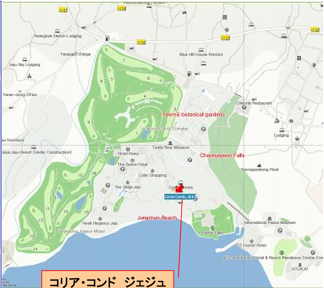
コリア・コンド ジェジュ 付近の宿泊施設